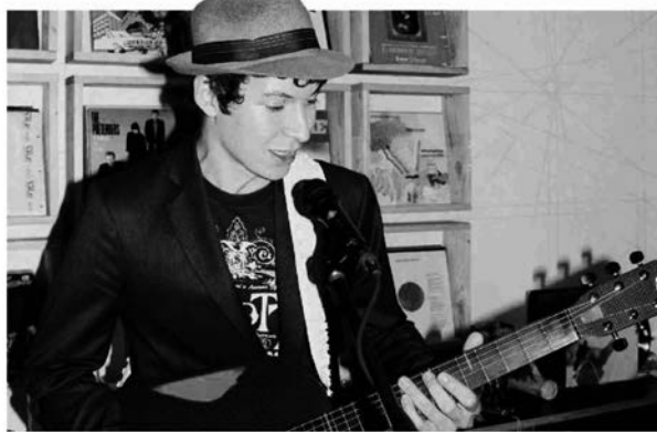
Mécanicien sur vélos, le chanteur a dû prendre des vacances pour participer à l'aventure. -»

— Complètement. Mais le jazz est la base de toutes les musiques. Approfondir mes connaissances dans ce style ne peut être que bénéfique pour la suite de ma carrière.