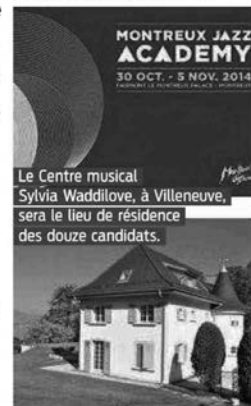
Le Centre musical Sylvia Waddilove, à Villeneuve, sera le lieu de résidence des douze candidats.