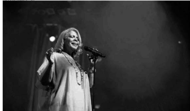
Patti Austin, voix d'or de Harlem, est depuis longtemps impliquée dans l'enseignement du jazz.