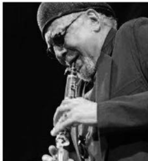
Au premier Montreux Jazz en 1967, ici à Cully en 2008, Charles Lloyd sera de l'Academy.